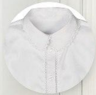
Рубашка арт. 16GG037