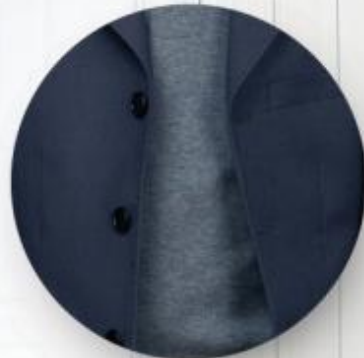
Пиджак арт. 16GP05