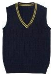
Жилет арт. 16GG038