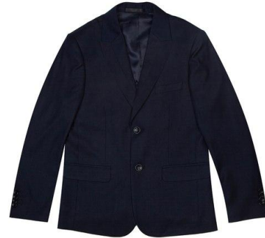
Пиджак арт. 01YN07