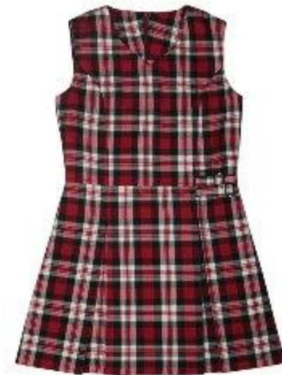
Сарафан арт. 16NR020