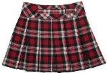
Юбка арт. 16NR022B