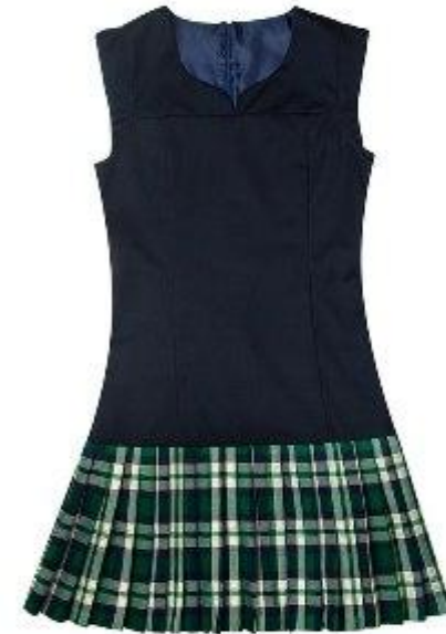
Сарафан арт. 16GG040