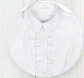
Блузка арт. 16GW027A