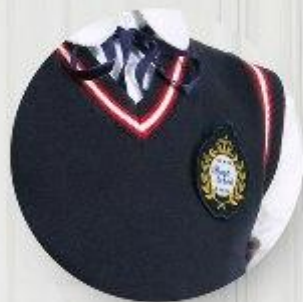
Жилет арт. 16NR019