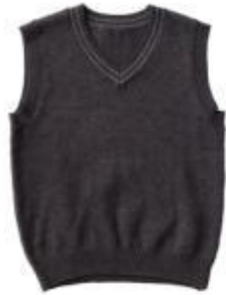
Жилет арт. 16GP02B