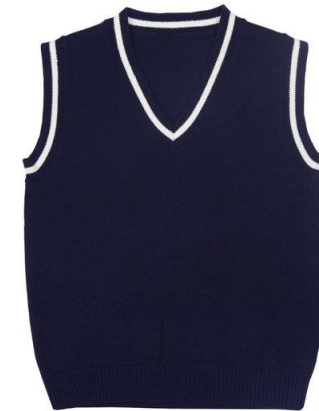
Жилет арт. 16NW003