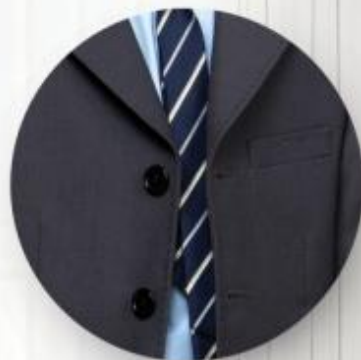
Пиджак арт. 16GP05