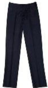
Брюки арт. 16NR023