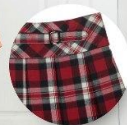
Юбка арт. 16NR022B