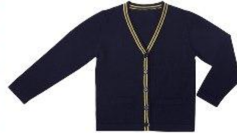
Кардиган арт. 16GG039