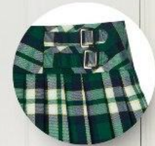
Юбка арт. 16GG041