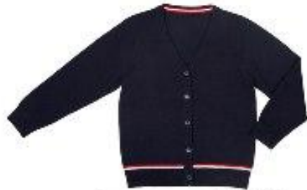
Кардиган арт. 16NR018