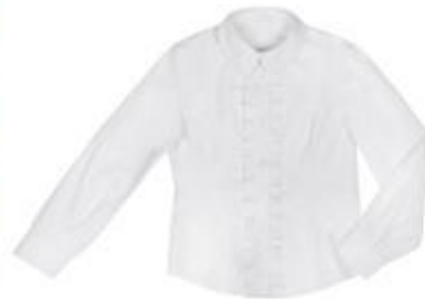
Рубашка арт. 16GW027A