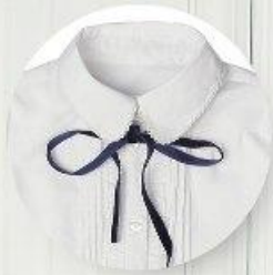
Блузка арт. 16NR016