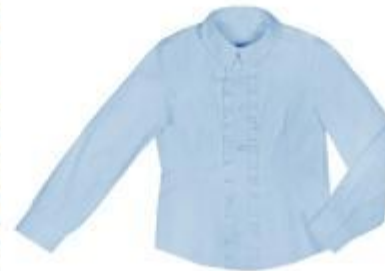
Рубашка арт. 16GW027B