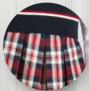
Юбка арт. 16NR022B