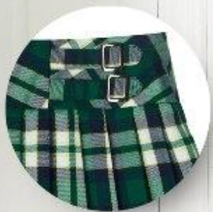
Юбка арт. 16GG041