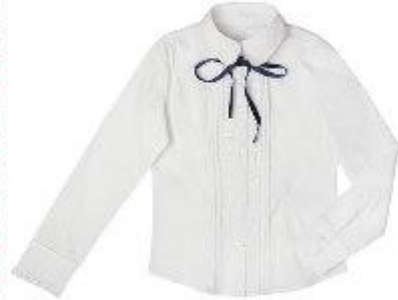
Блузка арт. 16NR016