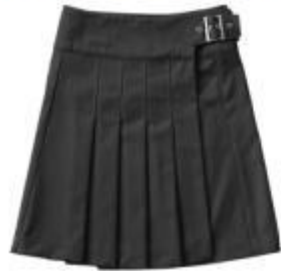
Юбка арт. 16NR06B