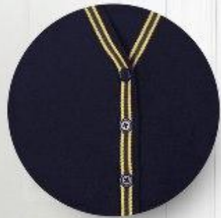
Кардиган арт. 16GG039