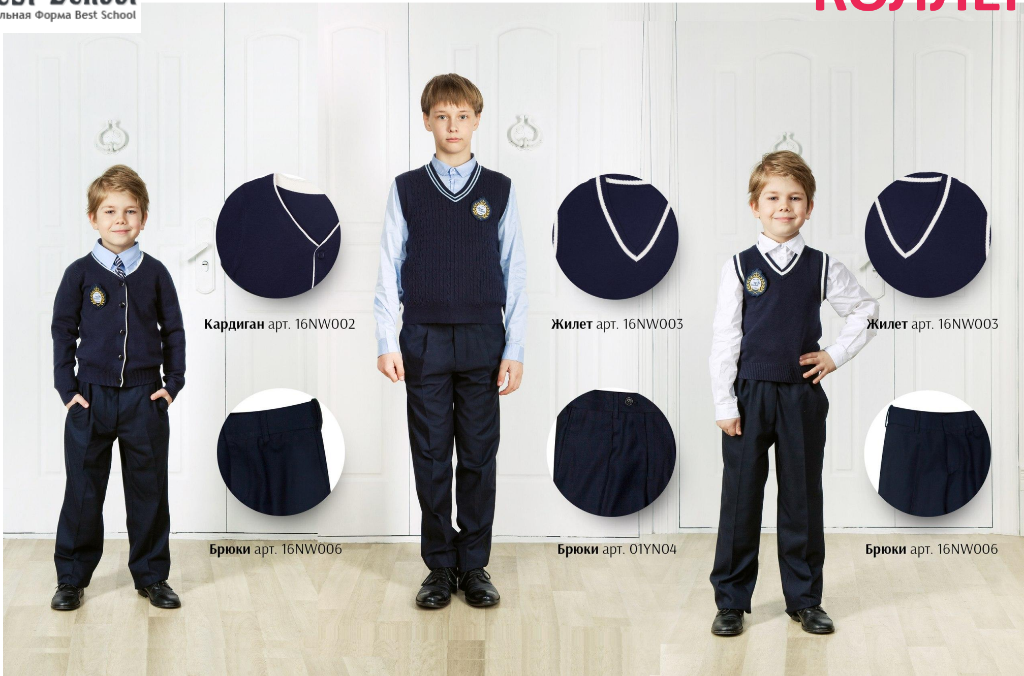
Кардиган арт. 16NW002