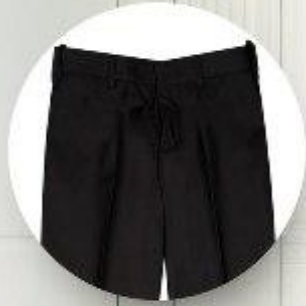
Брюки арт. 16GW032