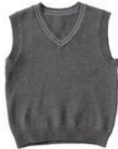
Жилет арт. 16GP02D