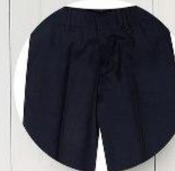
Брюки арт. 16NR023