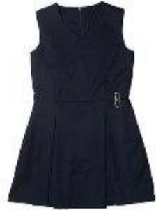
Сарафан арт. 16NR021