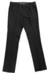
Брюки арт. 16NR025B