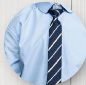
Рубашка арт. 16NW007B