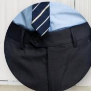
Брюки арт. 16NW006B