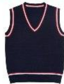
Жилет арт. 16NR019