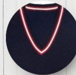
Жилет арт. 16NR019