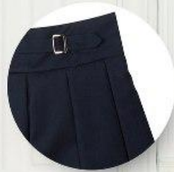
Юбка арт. 16NR22A