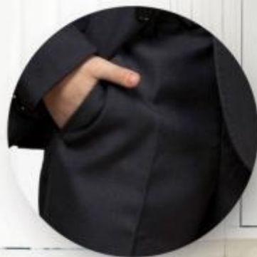
Брюки арт. 16NW006B