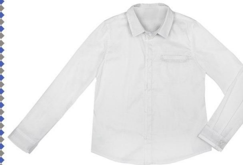
Сорочка арт. 01YN05A