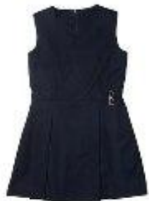
Сарафан арт. 16NR021