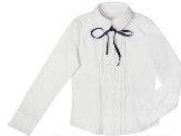
Блузка арт. 16NR016