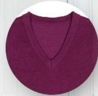
Жилет арт. 16GW030