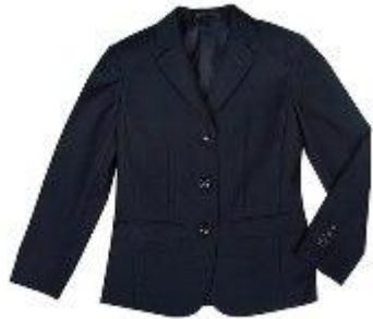
Пиджак арт. 16NR015