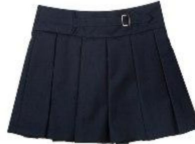
Юбка арт. 16NR022A