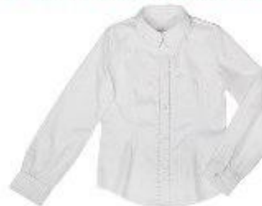
Блузка арт. 16GG037