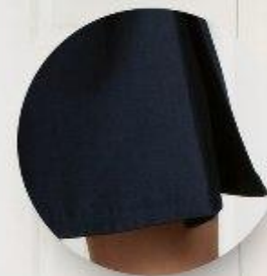
Сарафан арт. 16NR021