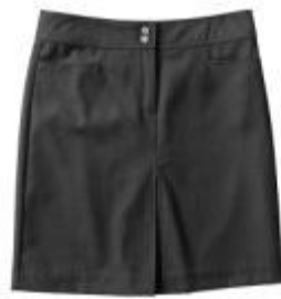
Юбка арт. 16NR05B