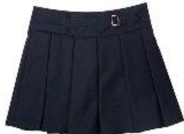
Юбка арт. 16NR022A