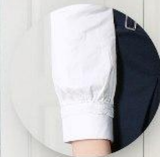
Блузка арт. 16GG037