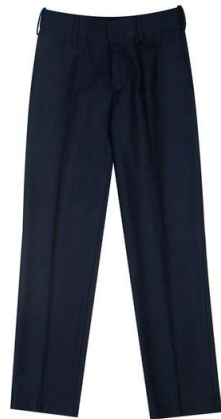
Брюки арт. 16NW006