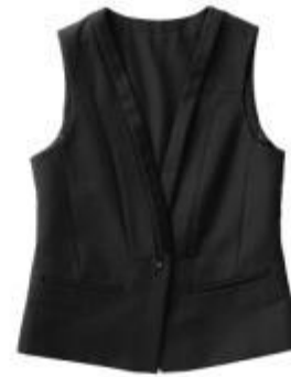
Жилет арт. 16NR31B