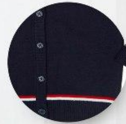
Кардиган арт. 16NR018