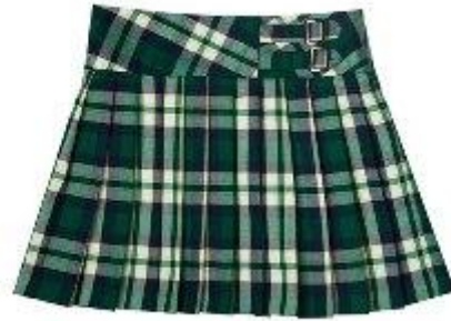
Юбка арт. 16GG041