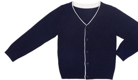
Кардиган арт. 16NW002