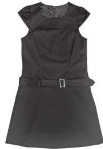
Сарафан арт. 16NR035B