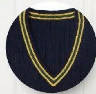
Жилет арт. 16GG038