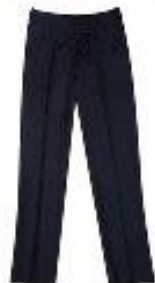
Брюки арт. 16NR023