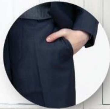
Брюки арт. 16NW006B