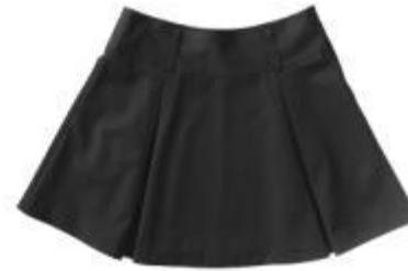
Юбка арт. 16NR041B