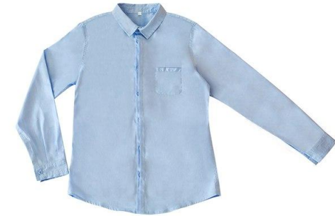
Рубашка арт. 01YN05B