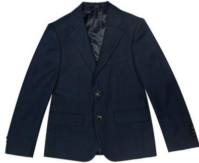
Пиджак арт. 16NW001