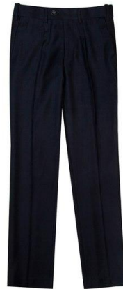
Брюки арт. 01YN04