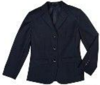
Пиджак арт. 16NR015