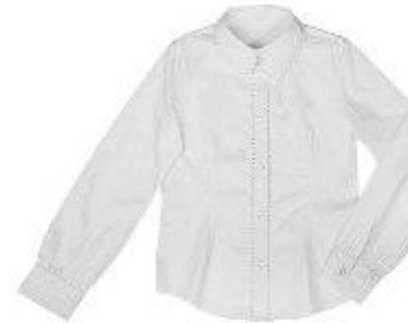
Блузка арт. 16GG037