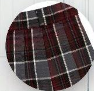
Юбка арт. 16GW028