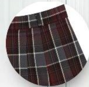
Юбка арт. 16GW028