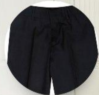
Брюки арт. 16NR023