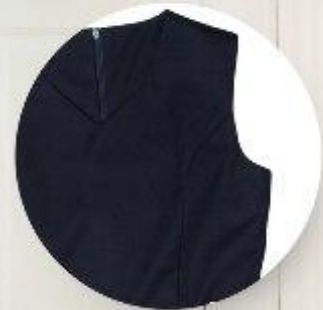
Сарафан арт. 16NR021