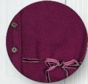
Кардиган арт. 16GW031