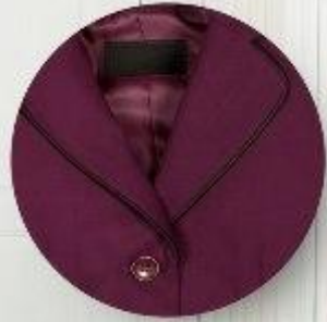
Пиджак арт. 16GW026